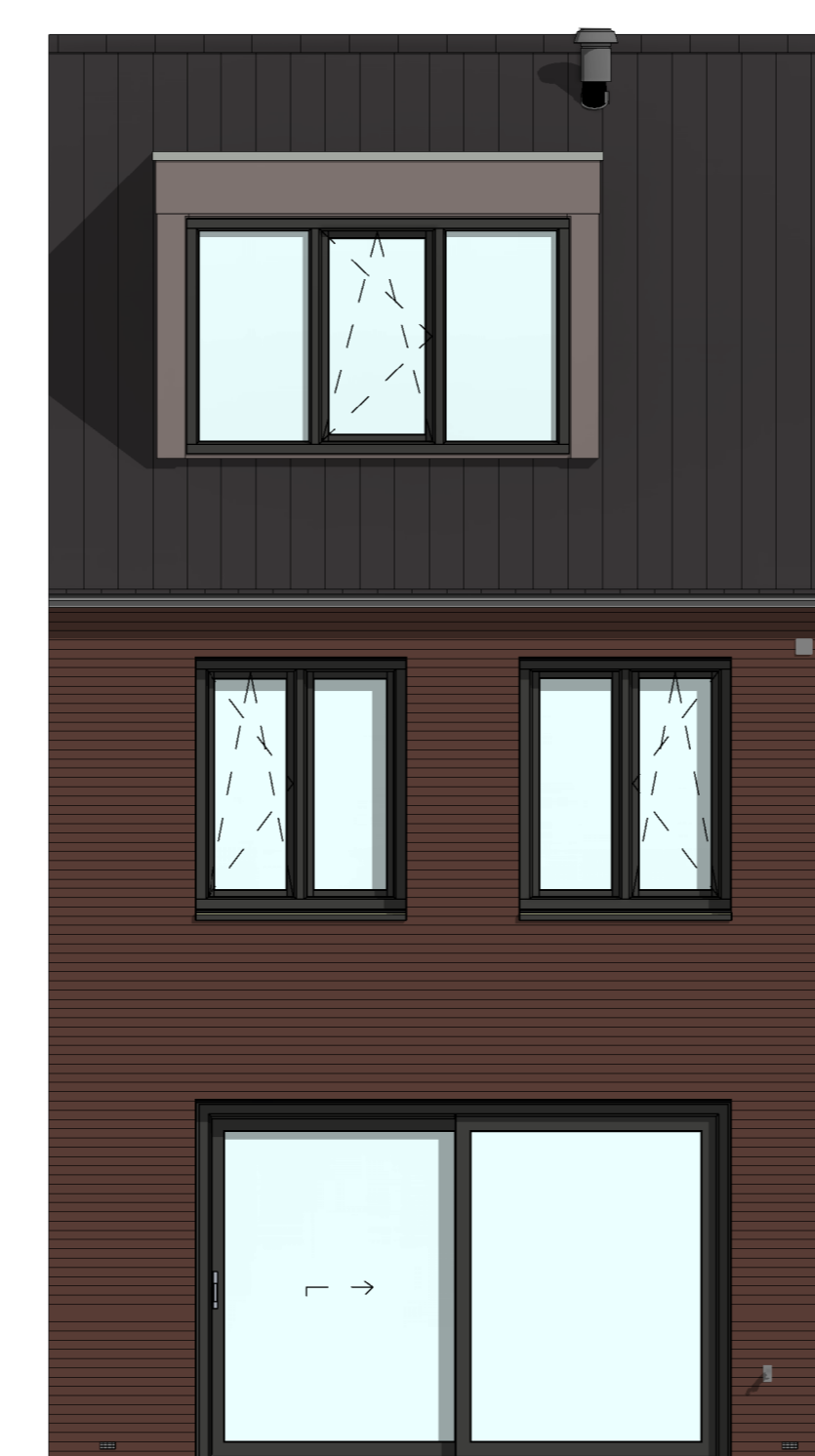
AG5006 - Achtergevel voorzien van een schuifpui DKA300 - Dakkapel aan de achtergevel (buitenwerks circa 3,0 m 2 zonder overstek)