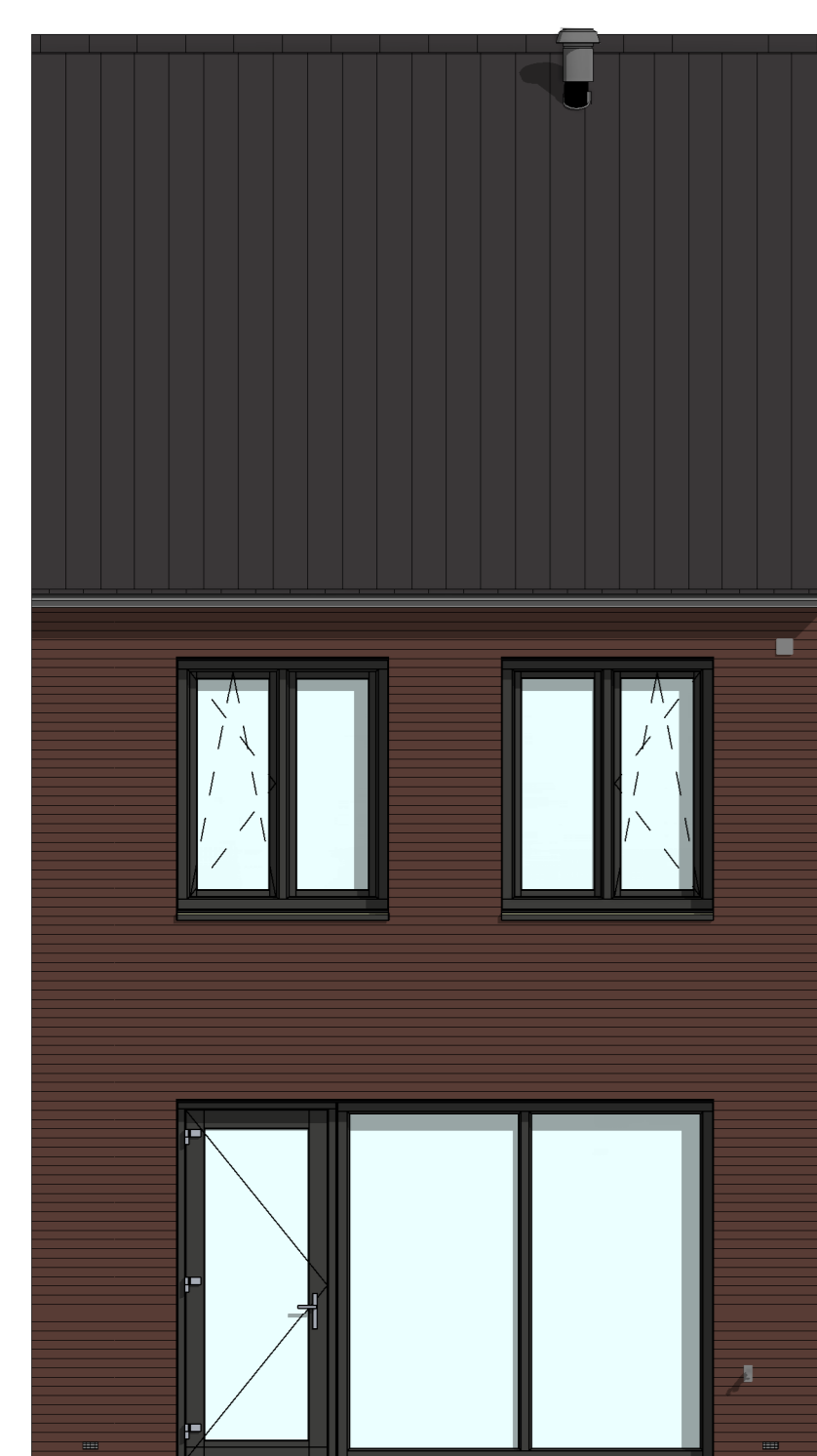
AG5001 - Achtergevel in basis uitvoering