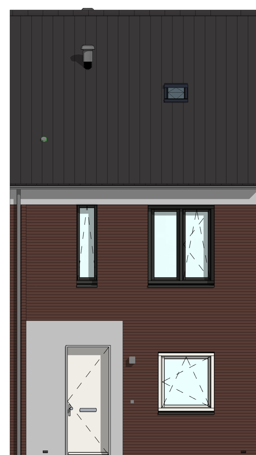
VG5001 - Basis voorgevel