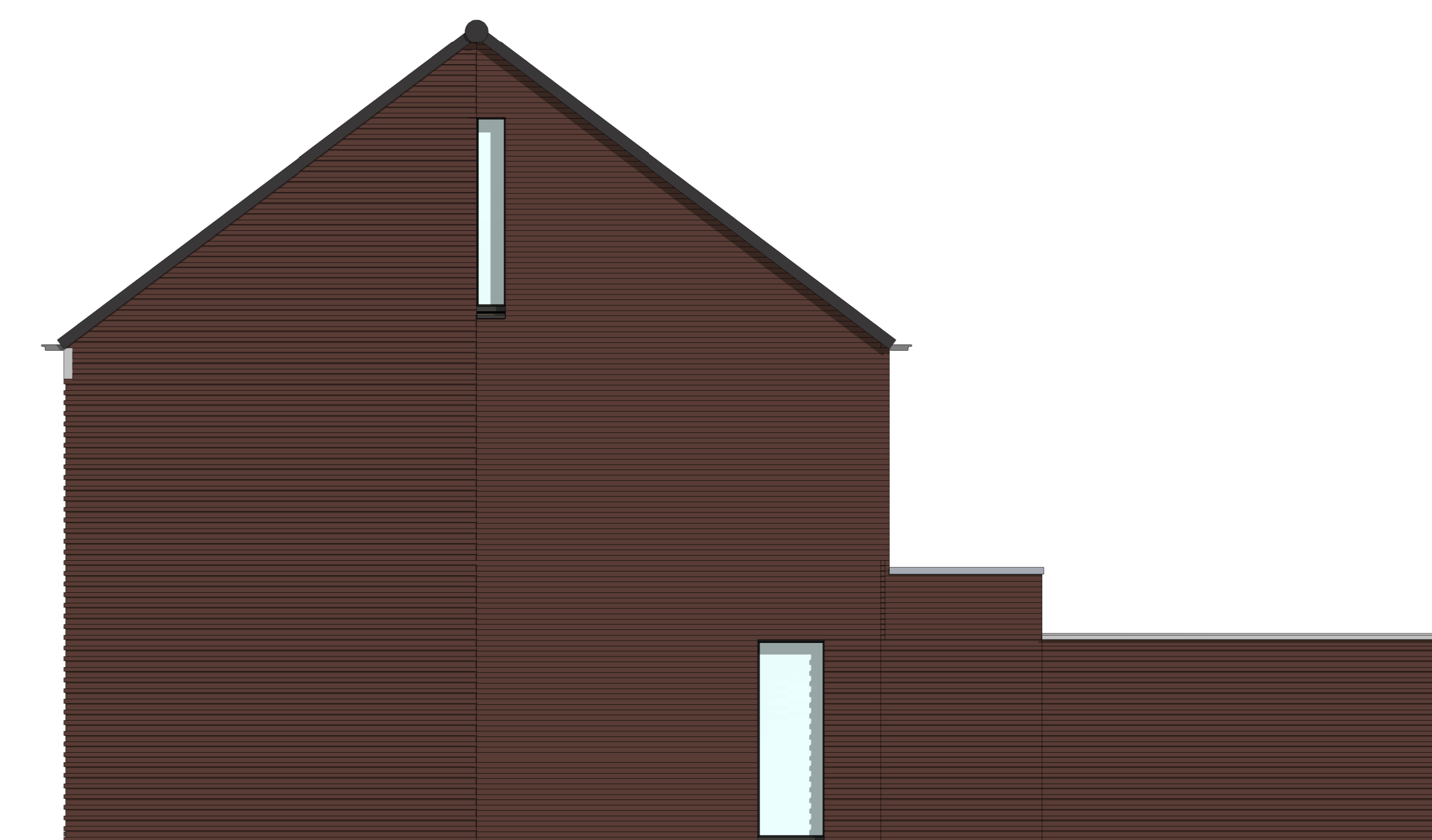
AB5418 - Aanbouw achtergevel, 1800mm