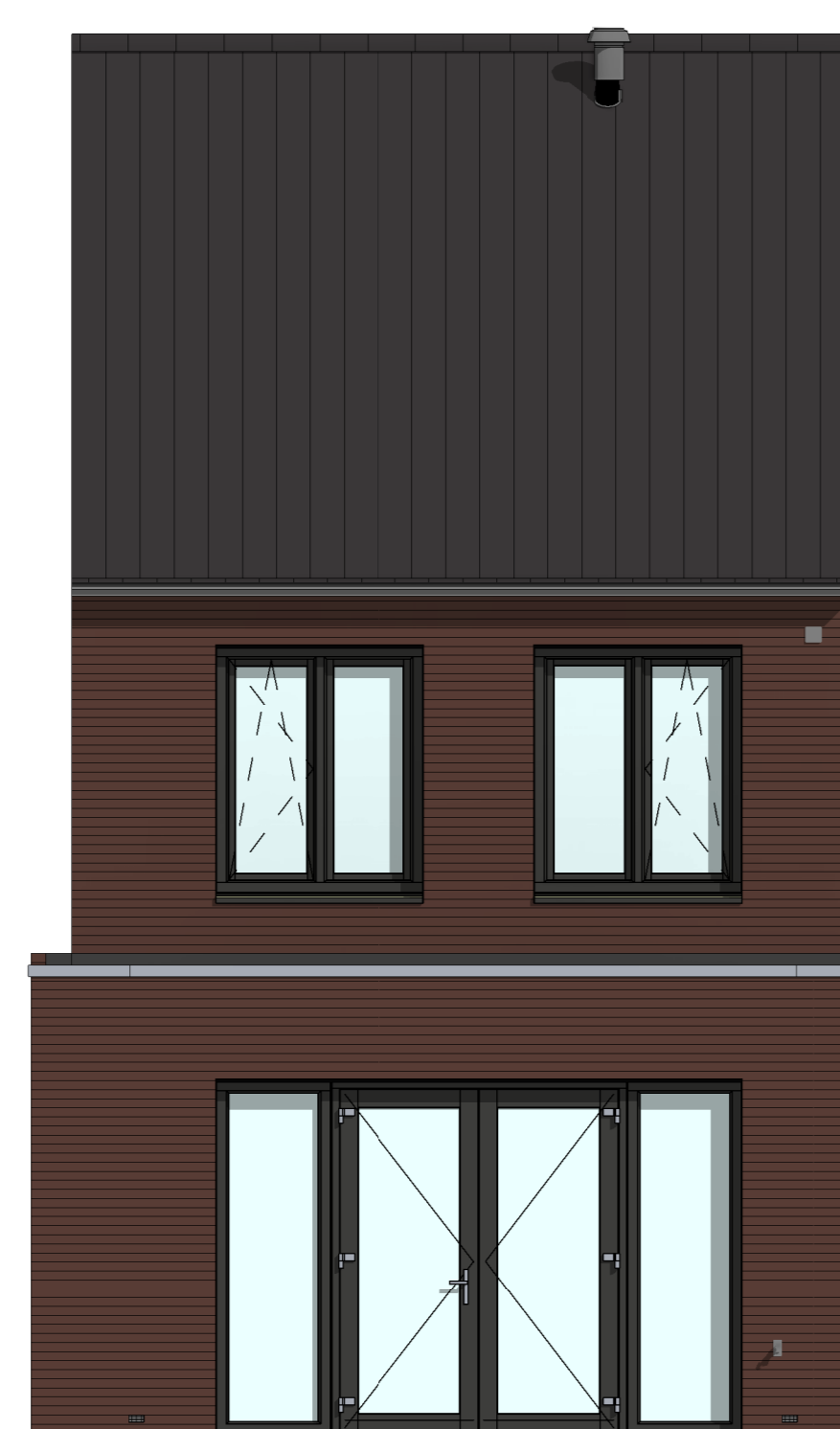
AB5412 - Aanbouw achtergevel, 1200mm AG5004 - Achtergevel voorzien van dubbele deuren met 2 zijlichten