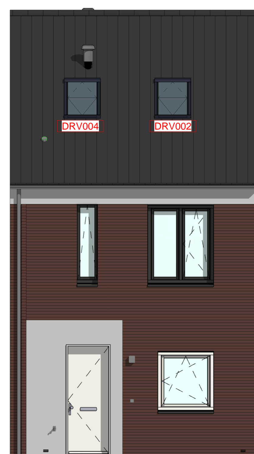
205000 - Buitenkraan in de voorgevel DRV002 - Dakraam Fakro FTW-V03 780x1400mm in de voorgevel, boven slaapkamer 2 (i.p.v. standaard dakraam 550x620mm) DRV004 - Dakraam Fakro FTW-V03 780x1400mm in de voorgevel, boven de badkamer