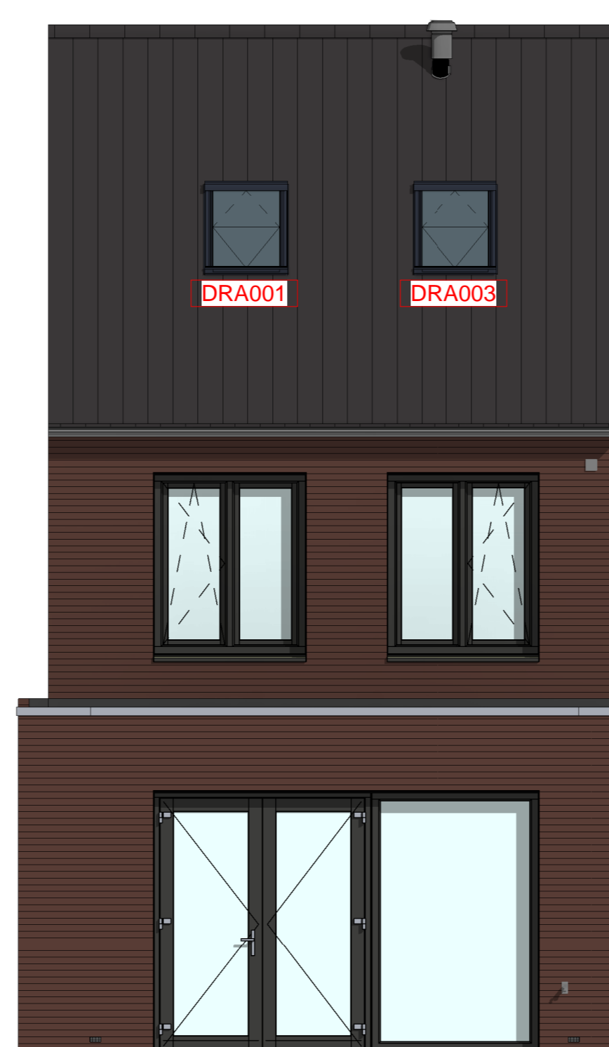
AB5418 - Aanbouw achtergevel, 1800mm AG5005 - Achtergevel voorzien van dubbele deuren met 1 zijlicht DRA001 - Dakraam Fakro FTW-V03 780x1400mm in de achtergevel, boven slaapkamer 1 DRA003 - Dakraam Fakro FTW-V03 780x1400mm in de achtergevel, boven slaapkamer 3