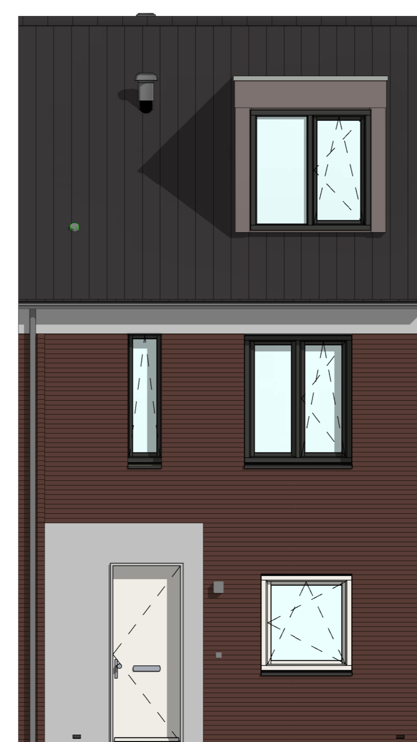
DKV200 - Dakkapel aan de voorgevel (buitenwerks circa 2,0 m 2 zonder overstek)